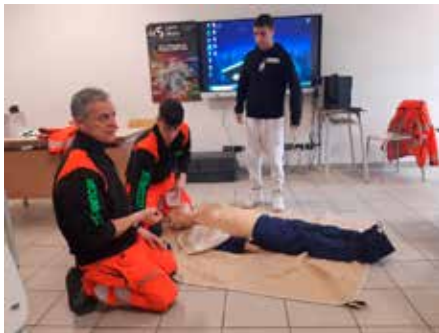
“Primo soccorso”, il progetto che salva vite