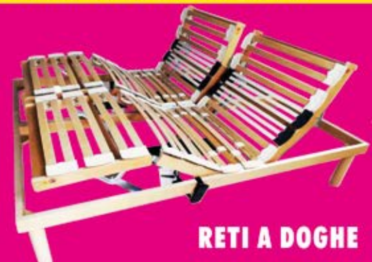
RETI A DOGHE

Pagamenti rateali 12/24 mesi senza spese né interessi