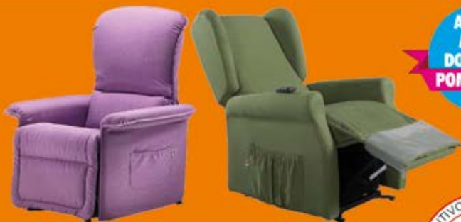
POLTRONE RELAX ALZAPERSONA