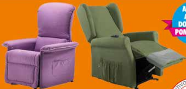
POLTRONE RELAX ALZAPERSONA