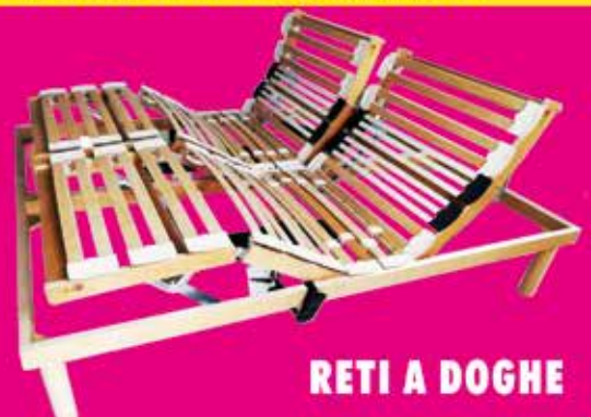
RETI A DOGHE

Pagamenti rateali 12/24 mesi senza spese né interessi