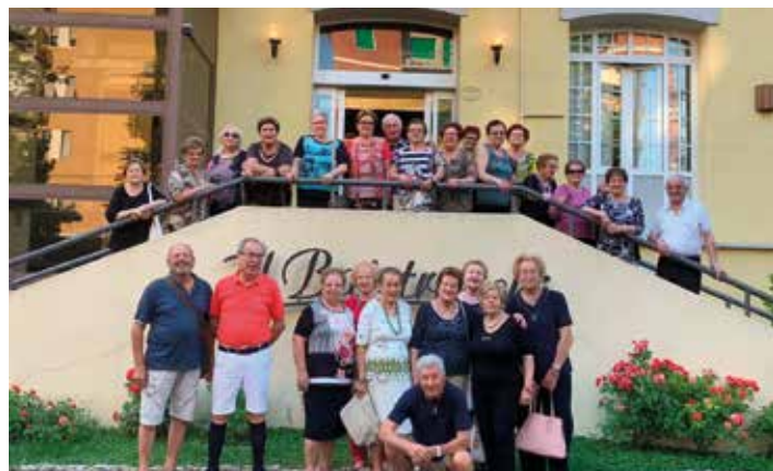
Foto di gruppo per i partecipanti ai soggiorni estivi per la terza età proposti dall'assessorato ai servizi sociali per il tramite operativo della Pro Loco. I nostri concittadini hanno trascorso un paio di settimane a cavallo tra giugno e luglio rispettivamente ad Andalo, sulle Dolomiti, e Salsomaggiore Terme, esprimendo soddisfazione sia per la bella location che per l'accoglienza e l'ospitalità delle strutture.